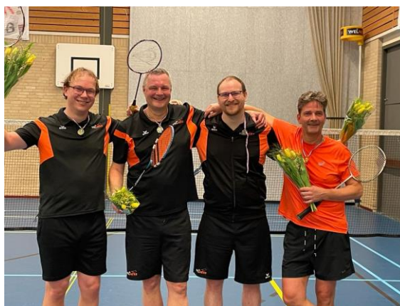
Het team dat tegen Loosdrecht het kampioenschap veilig stelde