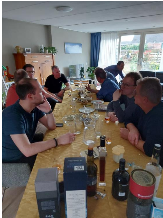
Eten en drinken aan lange tafels in Huize Sloeserwij.