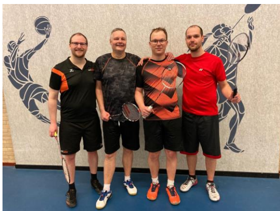
Het (ongeveer) vaste team