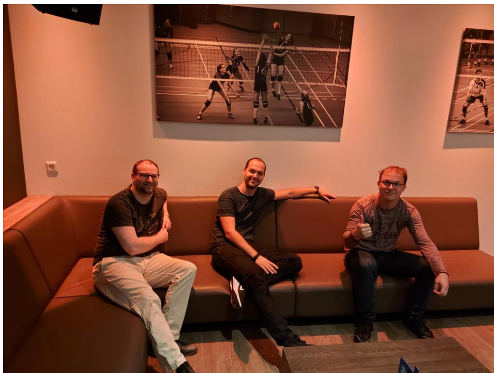
Een deel van H1 wachtend op de drankjes van de tegenstander na weer een overwinning

Al snel werd duidelijk dat Loosdrechtse BC onze naaste concurrent zou worden. Tot de heenwedstrijd in Loosdrecht stonden zij zelfs met enkele verliespunten minder, boven ons. Na een eclatante 1-7 gingen de punten mee richting Hoevelaken en waren de rollen omgedraaid. BCH H1 was de ploeg waarop gejaagd moest worden. Dat werd echter lastig omdat de volgende vier potjes met 8-0 onze kant op vielen. Terwijl Loosdrecht hier een daar punten liet vallen, werd het gat alleen maar groter. En toen was daar op vrijdag 10 februari de grote dag. Helaas was Bart Sloeserwijn op vakantie, zodat hij het eventuele kampioenschap niet ter plekke kon meemaken. Een 4-4 zou volstaan, en zo kon het gebeuren dat Kees met het binnenhalen van het vierde punt in zijn enkelpartij, het kampioenschap veilig stelde. Het feest werd ingetogen gevierd; Bart nam ergens in de sneeuw een extra biertje; in de zaal geen ereronde of buikschuivers. Een paar high fives volstonden.